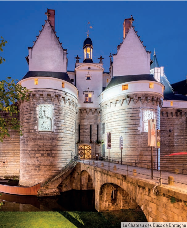
Le Château des Ducs de Bretagne