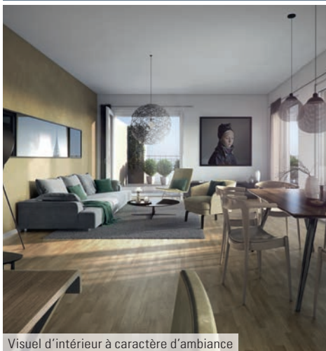
Visuel d'intérieur à caractère d'ambiance