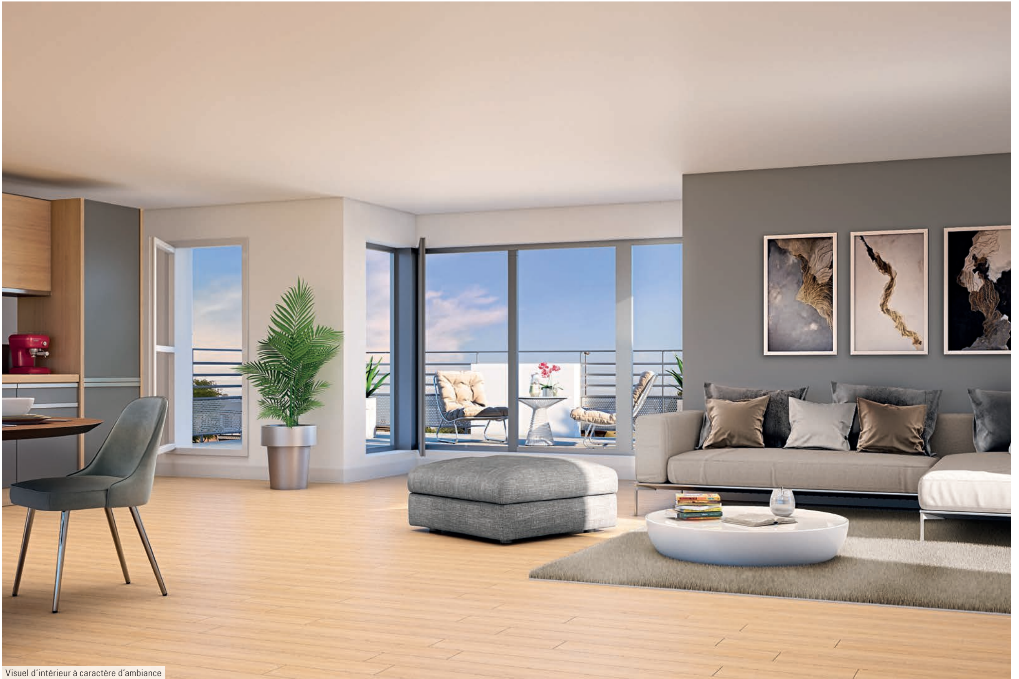
Visuel d'intérieur à caractère d'ambiance