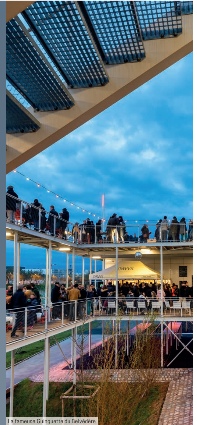
La fameuse Guinguette du Belvédère