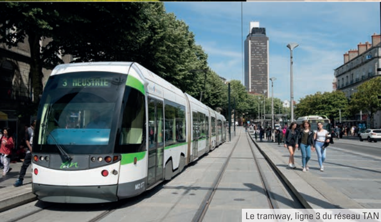
Le tramway, ligne 3 du réseau TAN