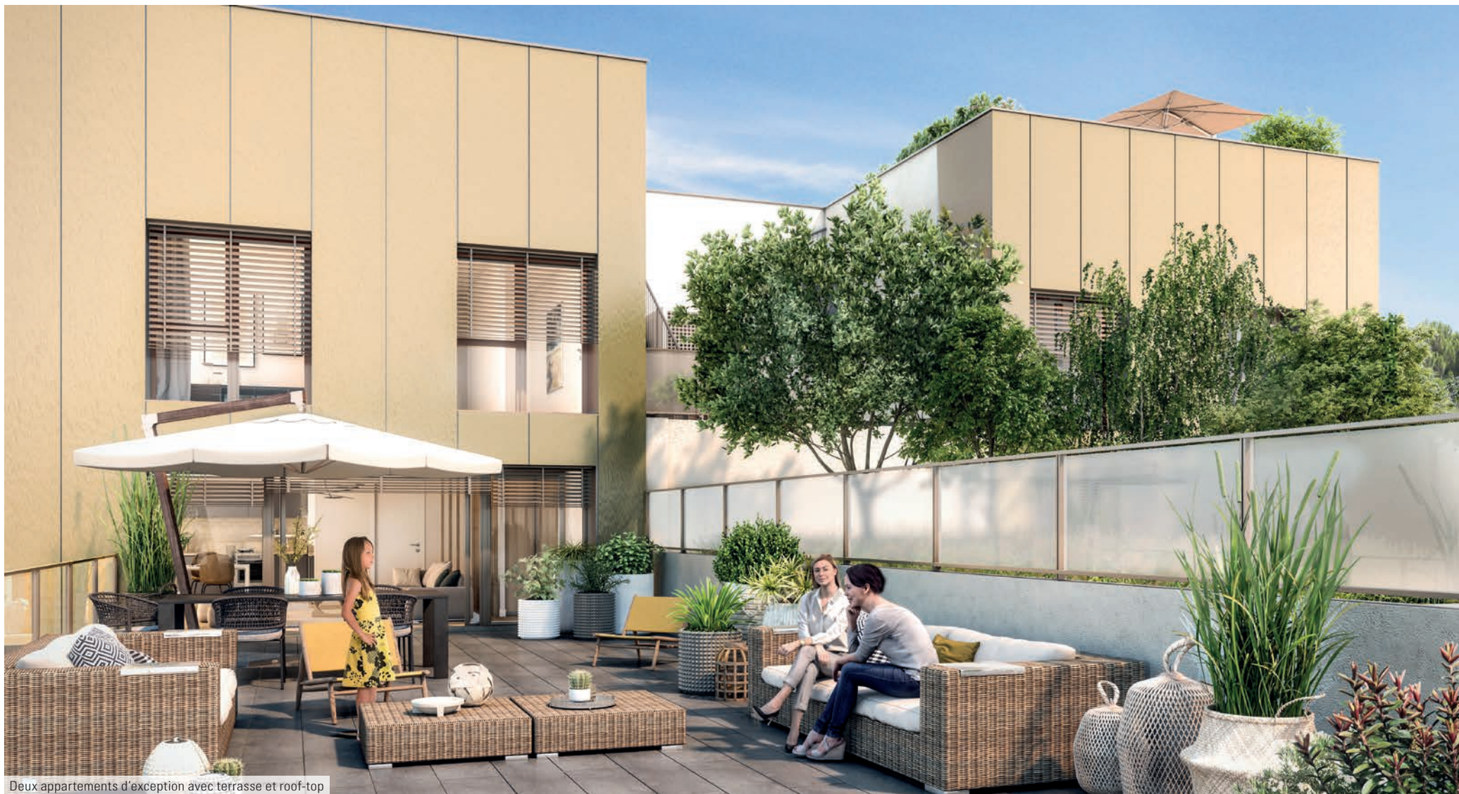
Deux appartements d'exception avec terrasse et roof-top