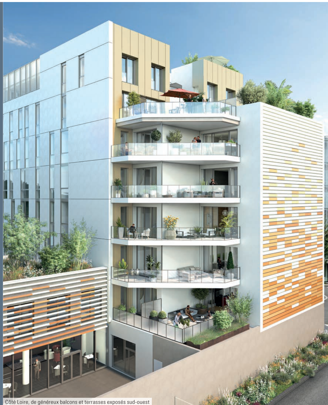
Côté Loire, de généreux balcons et terrasses exposés sud-ouest

Les matériaux de qualité illustrent une architecture à la fois épurée et pensée dans les moindres détails pour un résultat ultra-contemporain. Élément particulièrement remarquable de cette nouvelle adresse : une façade ornée de parements aux reflets dorés, comme symboles incontestables de son esthétique.