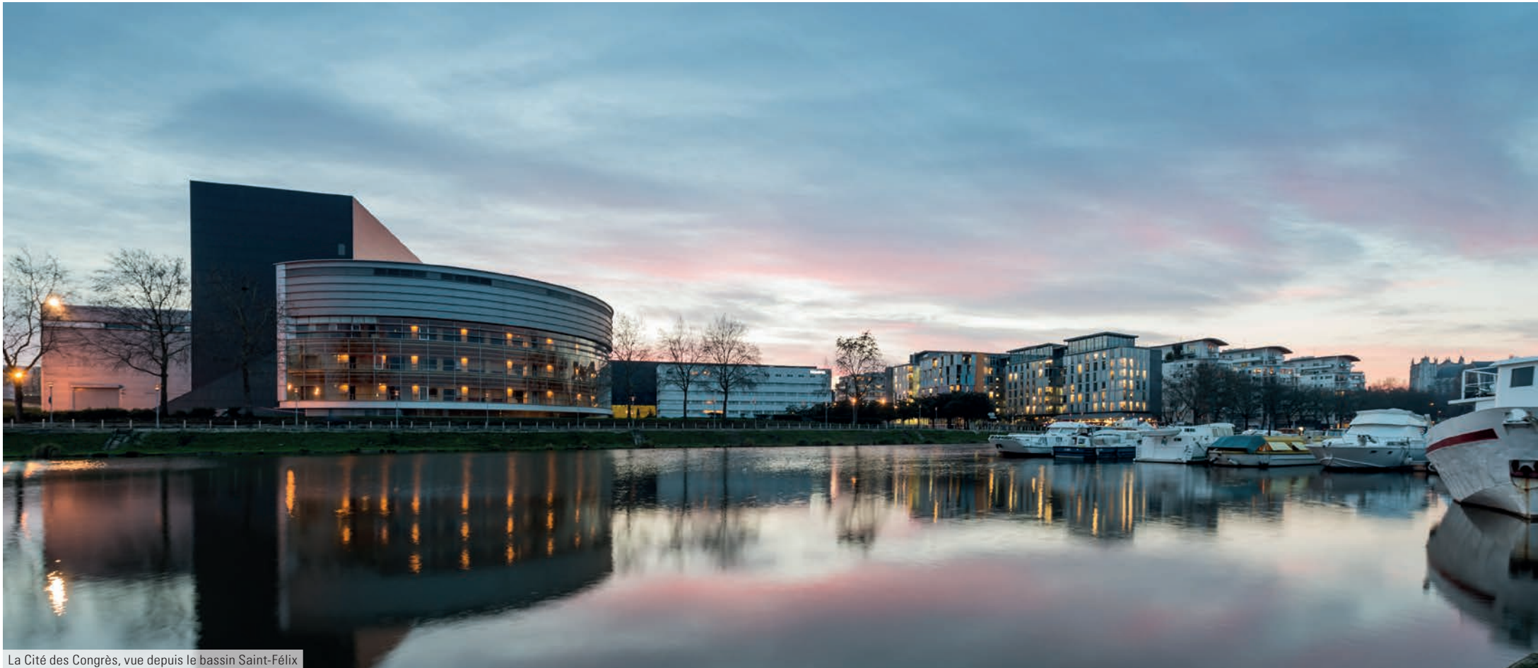
La Cité des Congrès, vue depuis le bassin Saint-Félix