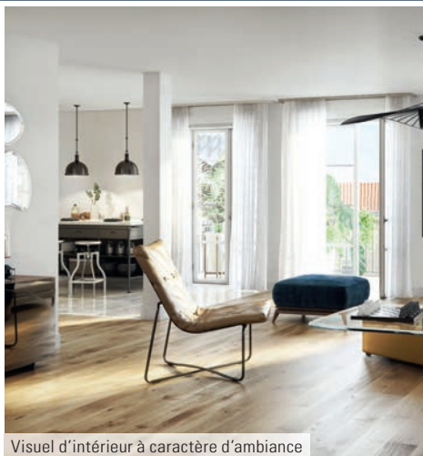
Visuel d'intérieur à caractère d'ambiance